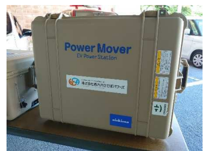
【外部給電器(パワームーバー)本体】